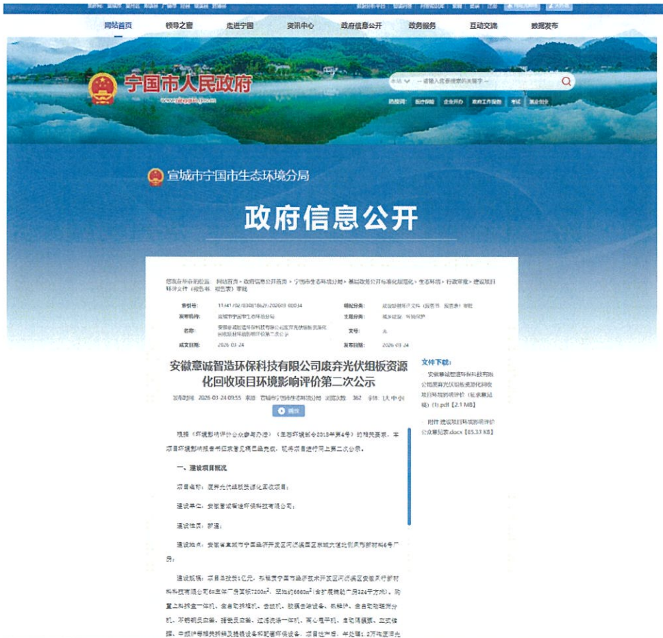
图 3-1 环境影响评价公众参与征求意见稿网络公示

https://www.ningguo.gov.cn/OpennessContent/show/3682817.html?branch=0