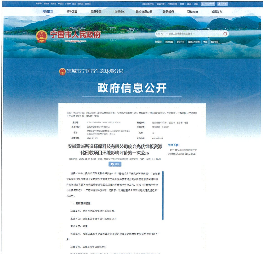
图 2-1 环境影响评价公众参与第一次公示