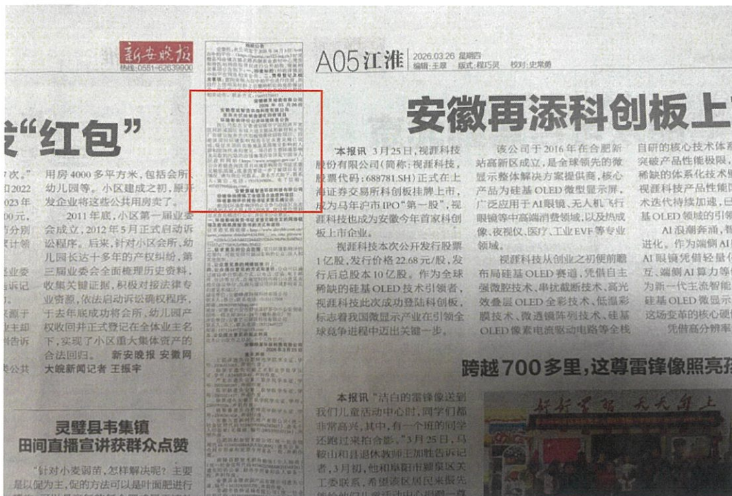
图 3-2 第二次报纸公示