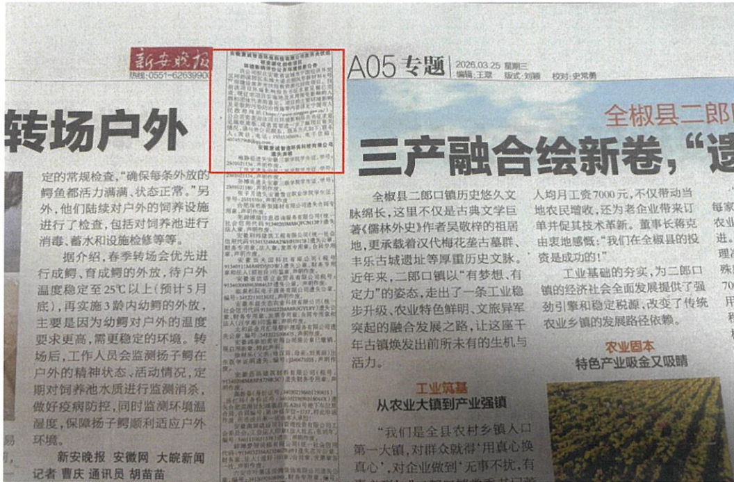
图 3-2 第一次报纸公示

根据《办法》第十一条第二款要求通过建设项目所在地公众易于接触的报纸公开，本次公示报纸选择“新安晚报”是建设项目所在地公众易于接触的报纸，符合要求。报纸分两次发布，第一次发布时间为2026年3月25日，第二次发布时间为2026年3月26日。具体公示情况如图3-2、3-3所示。