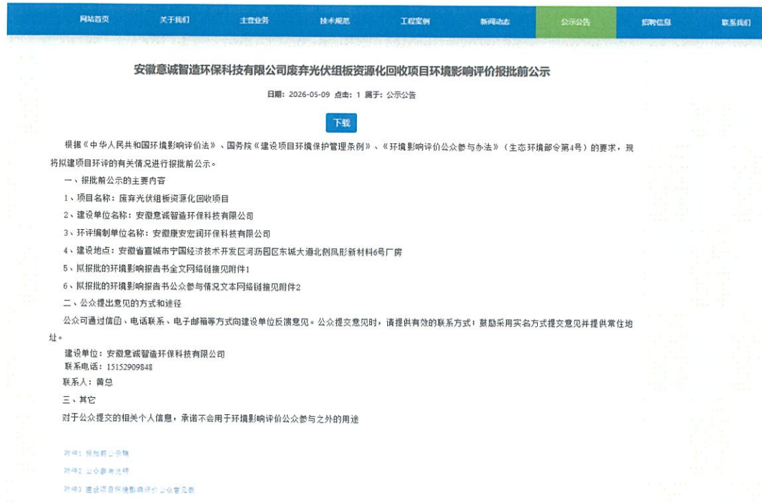
图 6-1 报送审批前网络公示截图